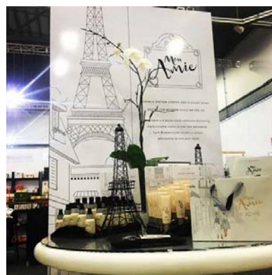
Autumn Gift Fair, NZ