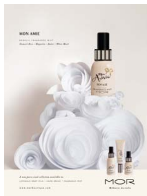
Magazine Ads., AUS