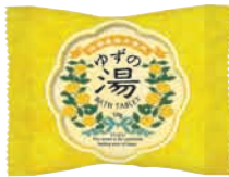
バスタブレット 価格:¥230+税 ロット:6P 内容量:50g 外装サイズ:W105×D15×H80mm