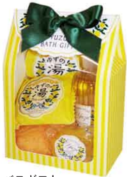
バスギフト 価格:¥1,200+税 ロット:3P 外装サイズ:W130×D70×H185mm