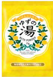
バスパウダー 価格:¥200+税 ロット:12P 内容量:35g 外装サイズ:W90×D10×H130mm