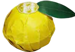
バスボム 価格:¥360+税 ロット:6P 内容量:150g 外装サイズ:φ72×H72mm