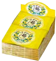
6個入り ディスプレイボックス サイズ:W95×D138×H53mm