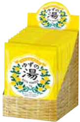
12個入り ディスプレイボックス サイズ:W92×D110×H130mm